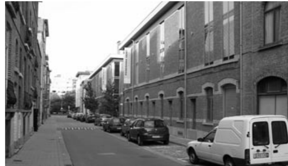
△ Nieuwe aanblik van de Zebrastraat

Graag nodigen wij u uit op ons wijkfeest met wafelbak in één van de mooiste sites van de wijk, nl. het binnenplein van de prachtig gerenoveerde Cirk in de Zebrastraat . Bij slecht weer beschikken we over een ruimte binnenin het complex. Iedereen is welkom: gezinsleden, familie en vrienden, vanaf 15 uur . Het hoogtepunt wordt dus de wafelbak met de vermaarde "Muinky"-wafels van onze wijk, samen met een drankje en in een gezellige sfeer.