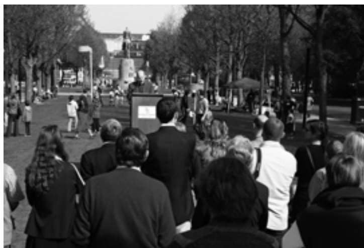
△ Het Koning Albert I-Park: één park, vele gezichten.