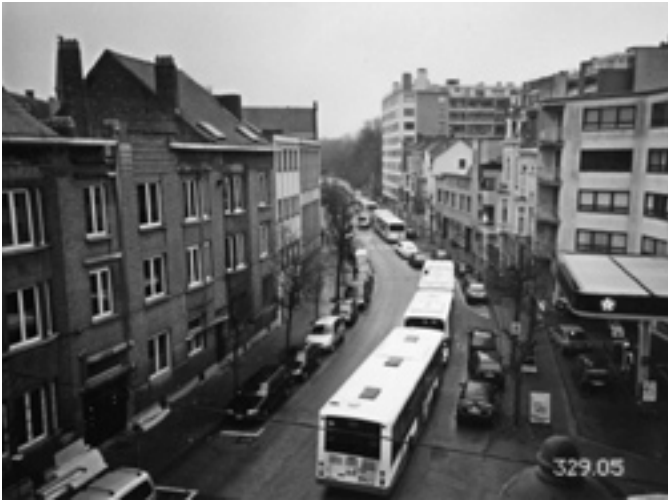
△ De Lijn: een ketting bussen in je straat!

De massale doortocht van de bussen van De Lijn door de Tentoonstellingslaan is nog steeds aan de gang. De Lijn beweert dat de reistijd van het Sint Pietersstation naar het Zuid via het Sint Lievenskruispunt 4 minuten langer duurt, en wil dus de 50-lijnen die hoofdzakelijk verpachte lijnen zijn, blijvend samen laten rijden met de 70-lijnen.